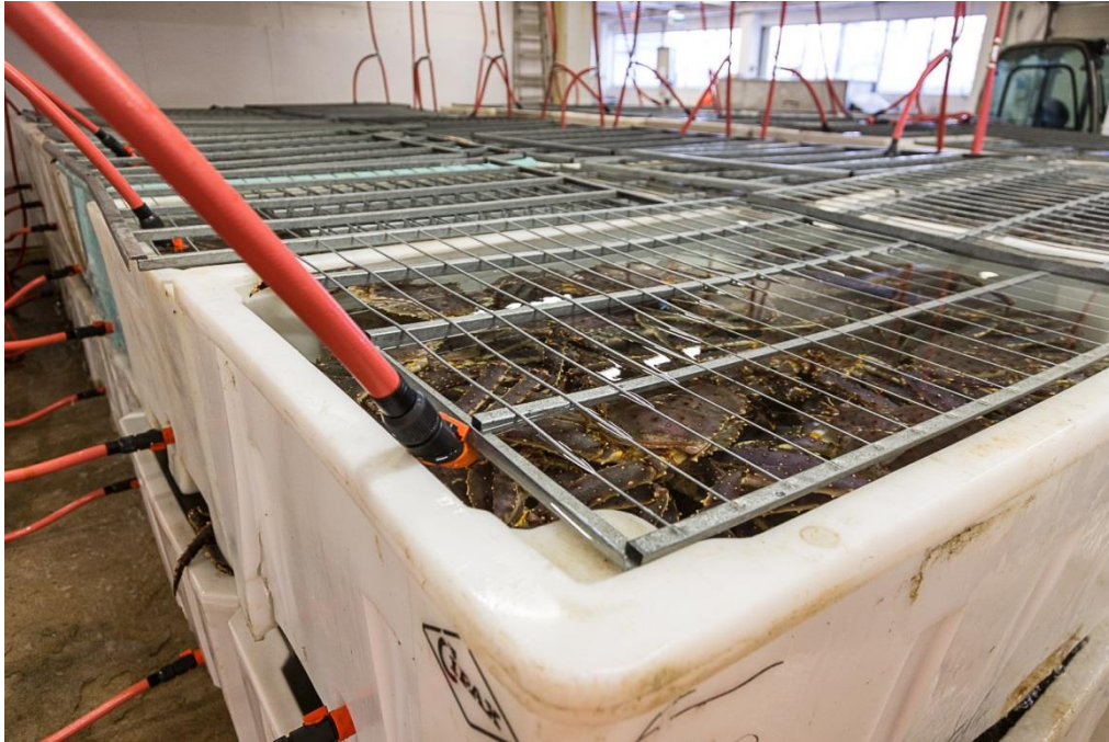
Bilde 2 Tradisjonelle plastkar brukt til levendelagring av kongekrabbe.

For kongekrabbe er det i dag vanlig med individtettheter på ca. 150 kg kongekrabbe pr. m 3 under levende mellomlagring i tradisjonelle 700 L plastkar (Bilde 2). Grunnet mangel på kunnskap på optimale individtetthet hos snøkrabbe ble det tatt utgangspunkt i tilsvarende tettheter i det første forsøket med snøkrabbe (forsøk I).